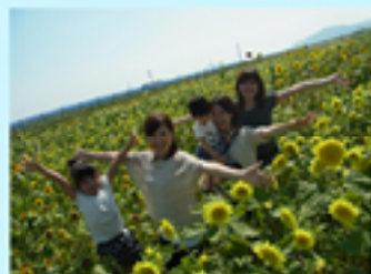
10万本のひまわり畑!